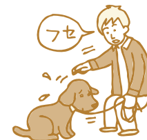
ひもを前下方に引く

② 犬が伏せた状態になったらひもを短く持って押さえるようにしてそのままの状態を保ち、上手にできたら褒めてあげましょう。