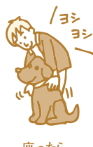
座ったら褒めてあげる