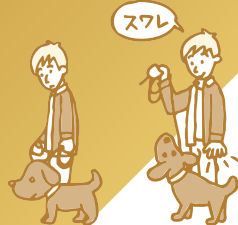
左足側に犬を付ける

③ 犬が立ち上がったたらもう一度腰に手を置いて座らせてから「ヨシヨシ」と撫でてあげましょう。