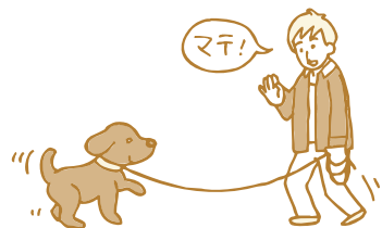
立ち上がってきたらマテをかけて元の位置に座らせる

③ 犬のところに行ってもう一度犬を元の位置に座らせ、犬が座ったまま動かずにいたら「ヨシヨシ」と撫でながら褒めてあげましょう。