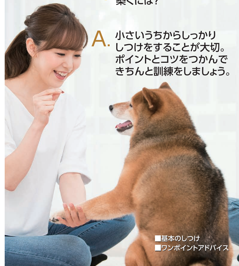
■基本のしつけ ■ワンポイントアドバイス

A. 小さいうちからしっかりしつけをすることが大切。ポイントとコツをつかんできちんと訓練をしましょう。