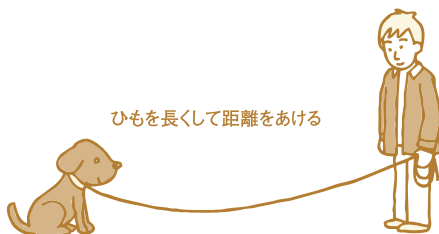
ひもを長くして距離をあげる

④ 今度は犬に背を向けて離れます。長くしたひもを持ちながら、「マテ」と言って犬の様子を確認しながら離れてみましょう。