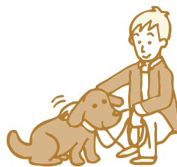
待っていたら褒めてあげる

⑤ 犬からある程度離れたところで立ち止まり、犬の方を向いて右手で「マテ」のサインを出しながら「マテ」と言い聞かせます。