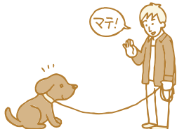
マテのサインのまま後ろへ下がる

② 犬と向き合ったまま静かに後退りして犬から遠ざかるようにします。犬が立ち上がったたり動いたら「スワレ」「マテ」と注意します。