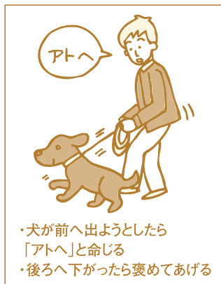
・犬が前へ出ようとしたら「アトへ」と命じる ・後ろへ下がったら褒めてあげる

③ 少しでも人の前に出ようようなことがあれば、正しい位置に戻します。犬が先に出ようとしたら、立ち止まって「アトへ」と言います。人が犬の側に付くようなことは決してしてはいけません。この時あくまでも犬を戻して左足側に付けましょう。左足を叩き「ツケ」と言って左足に付くことを教えます。