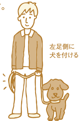
左足側に犬を付ける

② 「ツイテ」の命令をかけて左足から歩き始めます。犬が付いて歩く位置は、人の膝と犬の肩が並ぶ状態です。まず人の命令、そして人の動き、それに従って犬も歩き始めます。