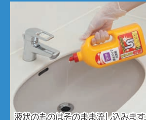
液状のものはそのまま流し込みます。

■定期的にパイプ洗剤を流す。 一般家庭用のパイプ洗剤はあまり速効性がなく、ひどい汚れや詰まりをすぐに解消することはできませんが、水はけが悪くなった程度の軽い症状には効果的です。パイプの詰まりや悪臭を防ぐ意味で2~3カ月に一度、定期的に使用すると良いでしょう。