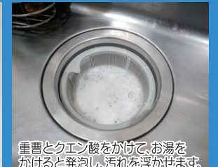
重曹とクエン酸をかけて、お湯をかけて発泡し、汚れを浮かせます。