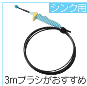
シンク用 3mブラシがおすすめ

詰まりの原因が排水口から距離のある時に有効な方法です。自在に曲がるワイヤーを排水口から入れてどんどん押し込んでいきます。ワイヤーが進まなくなったら、そこが詰まりの発生箇所なので、少し巻き戻しては掘り進めていくという具合に作業を進めます。詰まりのひどい場合には一度巻き戻して、先端に付着したごみを取り除きながら作業を進めると良いでしょう。