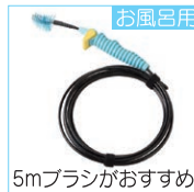
お風呂用 5mブラシがおすすめ

キッチンの流し台に使用されている蛇腹ホースには、ワイヤーの先端があたって破れることがあるので使用しないようにします。