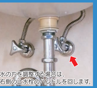
水の方を調整する場合は、右側の止水栓のハンドルを回します。

水の勢が強過ぎる、あるいは逆に弱過ぎるという時には、排水管の止水栓で水量をコントロールします。洗面所の場合、止水栓は洗面台の下にあり、普通はハンドルを右に回すと水量が少なく、左に回すと多くなります。湯と水が出る混合栓の場合は給水管が2本あり、ほとんどは右側が水用、左側がお湯用です。