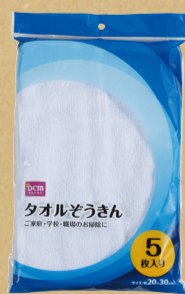
DCMブランド タオルぞうきん 5枚入り