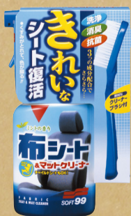
布シート&マットクリーナー

ソファ以外にも、取り外して洗えない布モノの汚れに良いかも! 今回使ったものはこちらです。